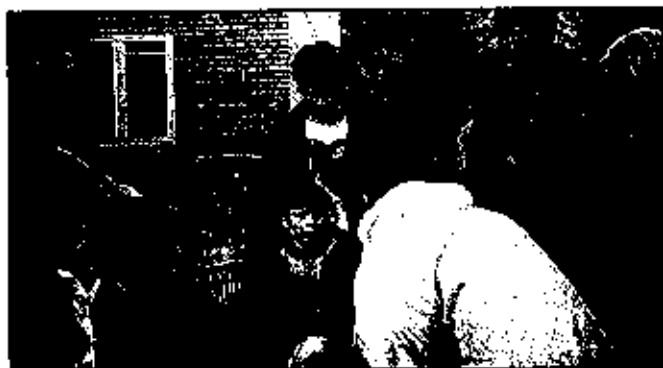
De fem 6 årige børn og en pædagog ankommer til Hald Ege 25/5-1999.

Vi glæder os meget til for anden gang at kunne få besøg af "vores" russiske feriebørn (nu 8 årige) fra det nordlige Rusland, nemlig byen MURMANSK. Vi mangler dog endnu penge til rejsen. Børnene havde i 1999 ca 2-3 ugers ferie her i Hald Ege, og siden har vi pr. breve og pakker fulgt deres dagligliv i Murmansk.